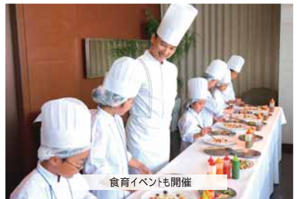
食育イベントも開催

「めっちゃくちゃ美味しいなあ」が1番嬉しいコメントで、最後に「えっ本当に調味料使ってないの?」とおまけのようにつぶやいてくれたら嬉しいです。